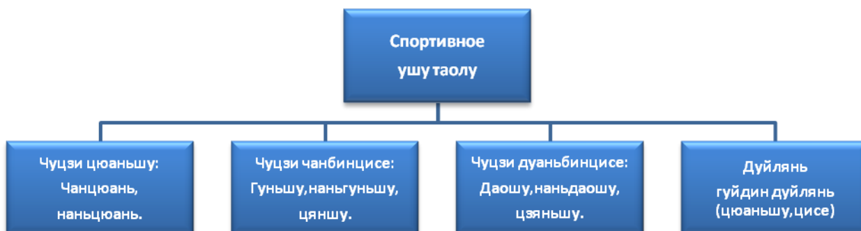
Схема разделения направлений ушу на этапе БУ-3, БУ-4.

В этом же периоде необходимо начать изучение парной работы – дуйлянь. Именно в дуйлянь спортсмен имеет возможность изучить юнфа - боевое применение технических действий, которые отрабатываются в таолу. Демонстрируя комплекс дуйлянь, спортсмен должен продемонстрировать насколько он понимает и владеет техникой ушу.